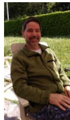
Aujourd'hui à la maison

Ca va faire presque 2 mois que j'ai donc dû m'éclipser de la paroisse en me soumettant au lent et long régime de la convalescence. Tout s'étant bien passé et moi-même allant de mieux en mieux, je suis à présent impatient de vous retrouver. Mais je veux ici dire toute ma profonde et immense reconnaissance pour toute la mobilisation des conseils de paroisse et presbytéral, des catéchètes, des visiteurs, des liturges et prédicateurs, des collègues de notre église et au-delà, et pour chacun d'entre vous qui m'avez adressé l'expression de votre amitié... par vos messages chaleureux, directs ou indirects qui m'ont soutenu véritablement et me portent encore ! Par la grâce de Dieu et la qualité de l'intervention chirurgicale, les résultats sur ma santé nous permettent d'être confiant et même optimiste pour la suite.