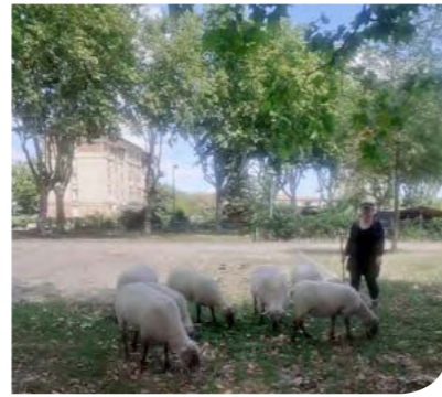
Des moutons déambulent en face de l'EPTM !

Autant d'idées, autant de présence, de réunions, de rencontres... N'hésitez pas à nous rejoindre.