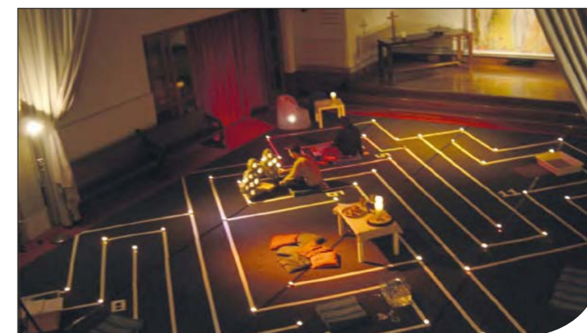
Photo du projet Labyrinthe.

Prochaine Journée mondiale de la prière : le vendredi 3 mars 2023. La célébration sera écrite par les femmes de Taiwan, sur le thème « Votre foi m'interpelle ».